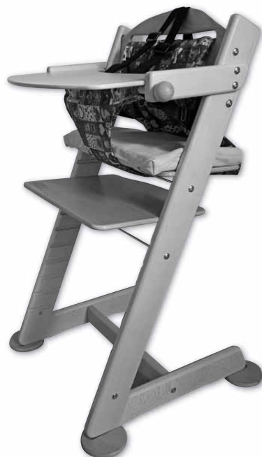
Židle Jitro® – Baby s pultíkem, kalhotkami a stabilizačními botičkami

V žádném případě nenechávejte děti sedět v přídržném zařízení bez dozoru!